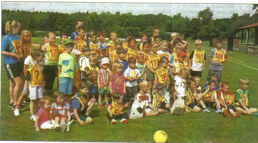
Freuten sich über Medaillen, Urkunden und Beutel mit kleinen Geschenken: Die Mädchen und Jungen nach dem Bambini- und Schüler-Lauf.

von Kerstin Fischer-Mahr, selbst eine aktive Läuferin, wurde wieder ein Bambini- und Schülerlauf ausgeschrieben und so freute sich der Gastgeber über die rege Teilnahme der Kinder von zwei bis 15 Jahren. Es war begeistert anzusehen, wie die